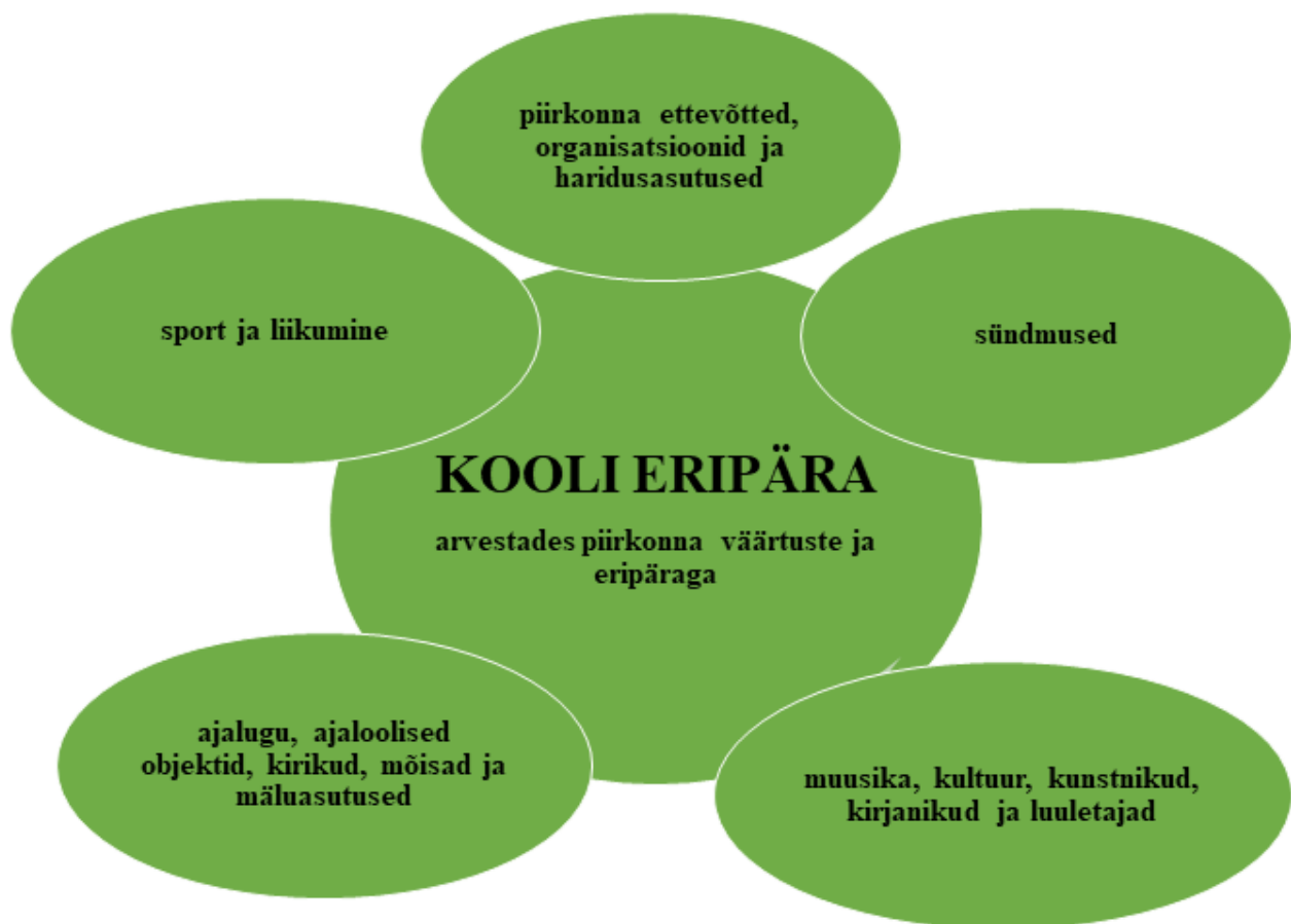
Joonis 1. Kooli eripära arvestades piirkonna väärtustega.

Väikse koolina märkame ja toetame iga õpilase individuaalsust.